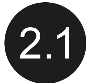
Bluetooth 2.1 + EDR