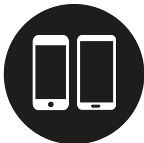
Kompatibel mit iPhone und Android-Geräten